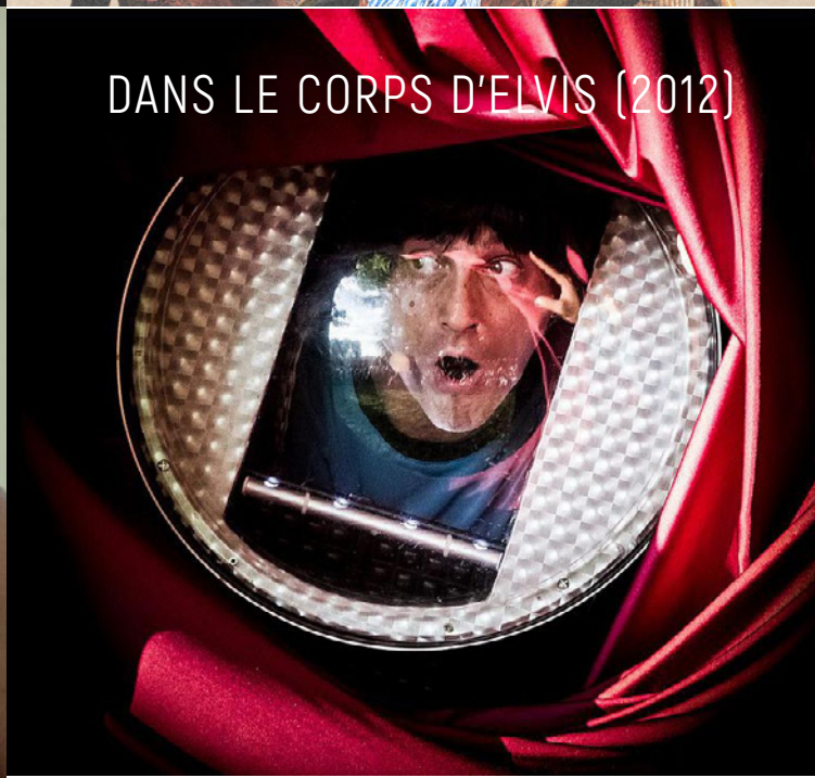
DANS LE CORPS D'ELVIS (2012)