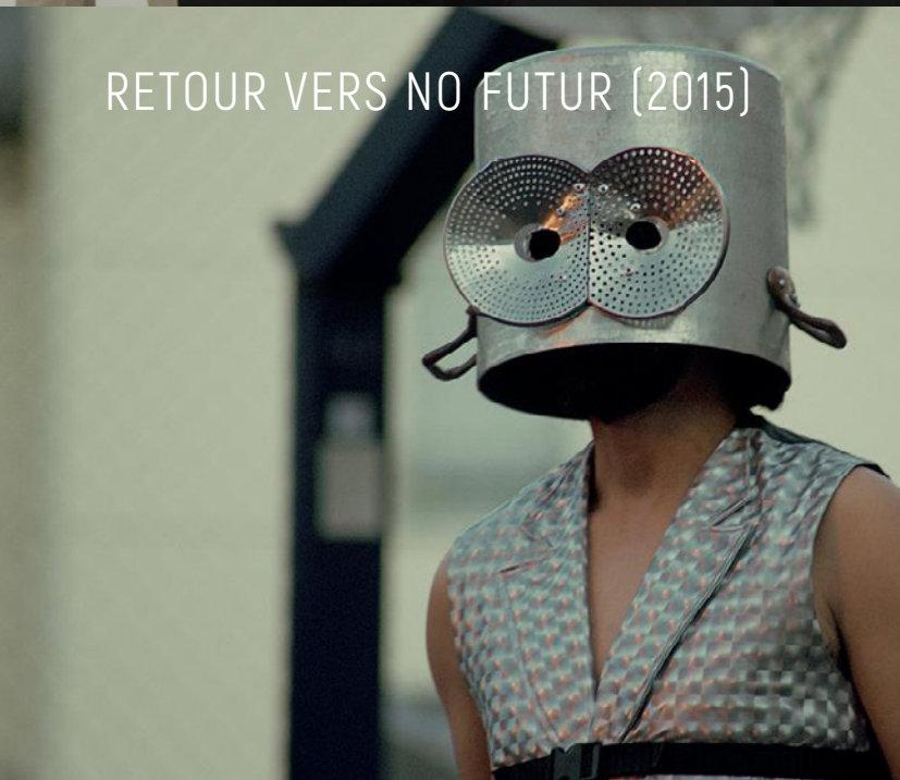
RETOUR VERS NO FUTUR (2015)