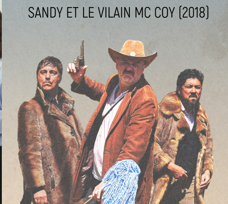
SANDY ET LE VILAIN MC COY (2018)