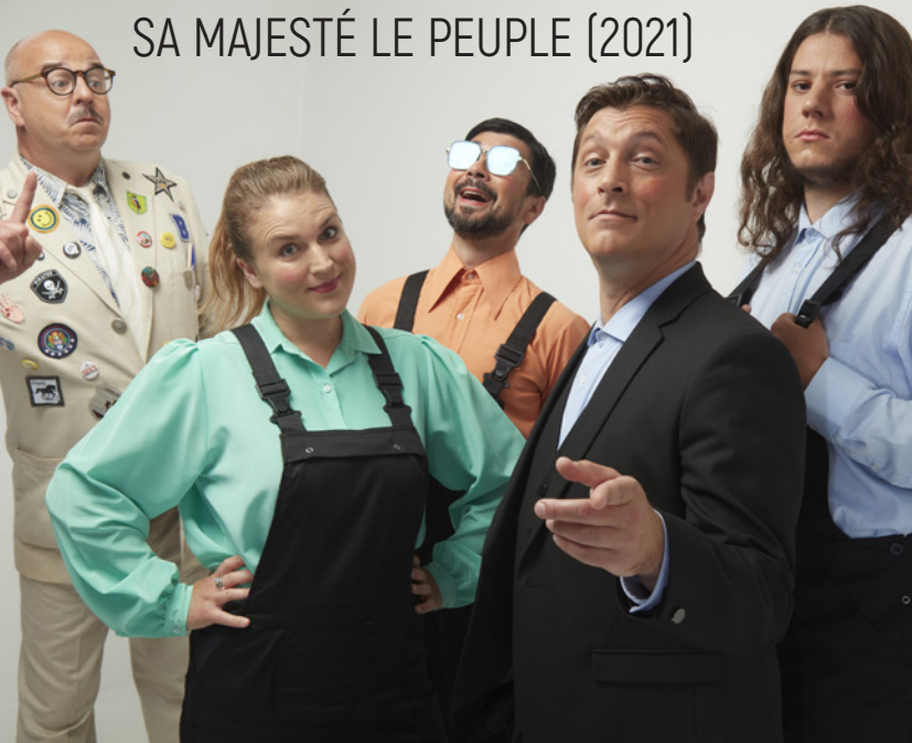
SA MAJESTÉ LE PEUPLE (2021)